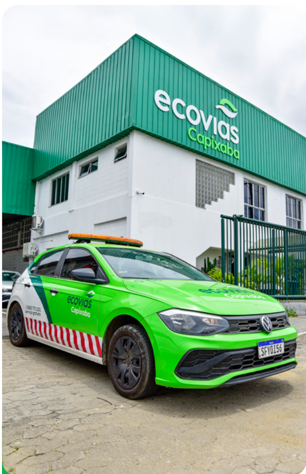
Serviço de Atendimento ao Usuário (SAU)