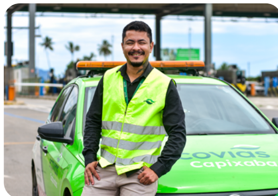
Serviço de Atendimento ao Usuário (SAU)