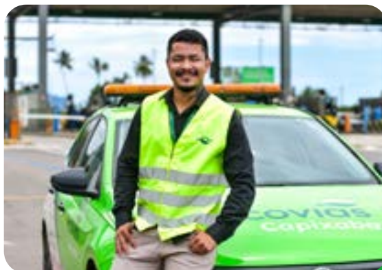
Serviço de Atendimento ao Usuário (SAU)