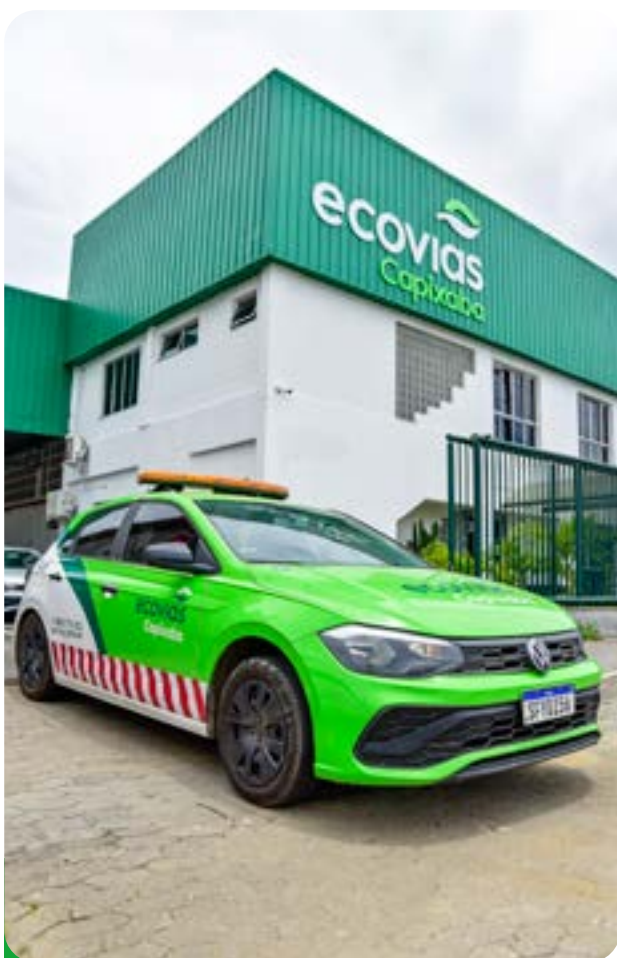
Serviço de Atendimento ao Usuário (SAU)