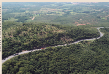
Trecho da serra de Bocaiuva na BR-135 que será duplicado

Os proprietários de imóveis ao longo da rodovia também têm responsabilidades na preservação da faixa de domínio. No caso das propriedades rurais, é necessário que o responsável pela área instale cercas em toda a extensão de frente, de acordo com o tipo de atividade desenvolvida. A cerca deve garantir, por exemplo, que os animais não entrem na estrada, pois, em caso de acidente, o proprietário poderá ser responsabilizado. É importante ressaltar que as cercas da rodovia têm a função exclusiva de delimitação da faixa de domínio.