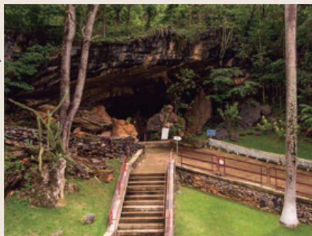
Próximo à entrada da gruta há uma trilha aberta aos visitantes