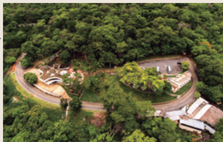
A gruta fica em uma área verde preservada