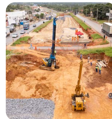
Obras perímetro urbano Bocaiuva