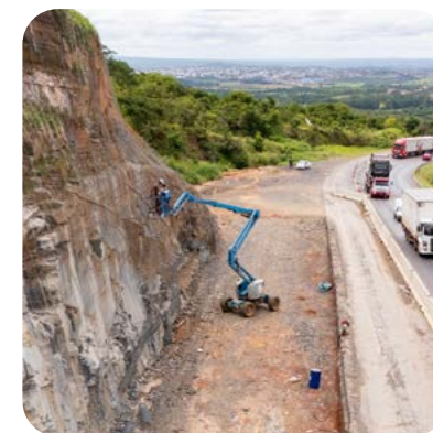
Detonação de rocha em Bocaiuva para obras de duplicação

Além do Contorno de Montes Claros, a concessionária também é responsável por diversas melhorias estruturais que serão realizadas ao longo dos anos na BR-135. Entre as principais ações, estão a manutenção e recuperação de pavimentos, a construção de passarelas e a ampliação da capacidade viária, com mais de 130 quilômetros de duplicação e 110 quilômetros de terceiras faixas. Essas obras fazem parte de um compromisso contínuo de modernização da infraestrutura rodoviária, garantindo mais segurança, eficiência e qualidade para os motoristas que utilizam a rodovia diariamente.