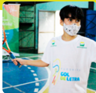
Divulgação Fundação Gol de Letra

A Fundação Gol de Letra retomou gradualmente suas atividades presenciais na pandemia, de forma adaptada aos cuidados sanitários, entendendo que as ações são importantes para amparar e orientar os atendidos e seus familiares. Para isso, elaboraram um Protocolo de Retorno que garante o distanciamento social. O Programa mantém a realização de atividades virtuais, assim como oficinas culturais e aulas de formação para o mercado de trabalho.