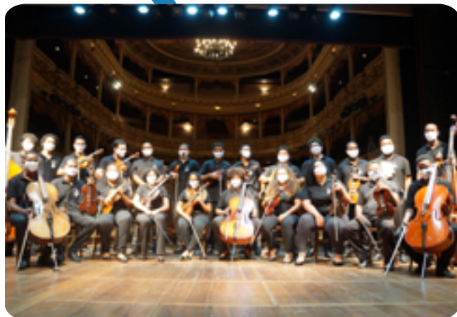
Divulgação Orquestra de Cordas da Grotta