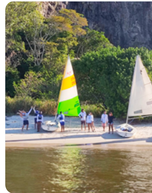
Divulgação Projeto Graef

isolamento social o Projeto Graef não ficou parado e passou a funcionar de forma virtual. Os temas trabalhados vão muito além das tradicionais aulas de vela, e incluem inclusive a conscientização sobre a covid-19. Aproveitando os encontros virtuais, também foram debatidos temas como discriminação racial e sustentabilidade com os alunos e alunas.