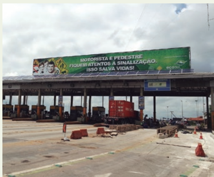
Praça do Capão Seco, na BR-392, tem sistema fotovoltaico

A implantação do IDA está inserida na Agenda Socioambiental e Territorial do Ministério da Infraestrutura (Minfra), pasta para o período 2020/2022. Uma das diretrizes da agenda é aprimorar a inserção das variáveis socioambiental e territorial nas fases de planejamento, implantação e operação dos projetos de infraestrutura no Brasil. A participação no processo de avaliação ocorreu por adesão voluntária, segundo a Portaria nº 396, de 25 de novembro de 2019. O índice passa a ser medido anualmente, compreendendo o período de 1º de janeiro a 31 de dezembro.