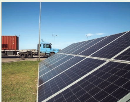
Projeto de ecoeficiência com placas de energia solar