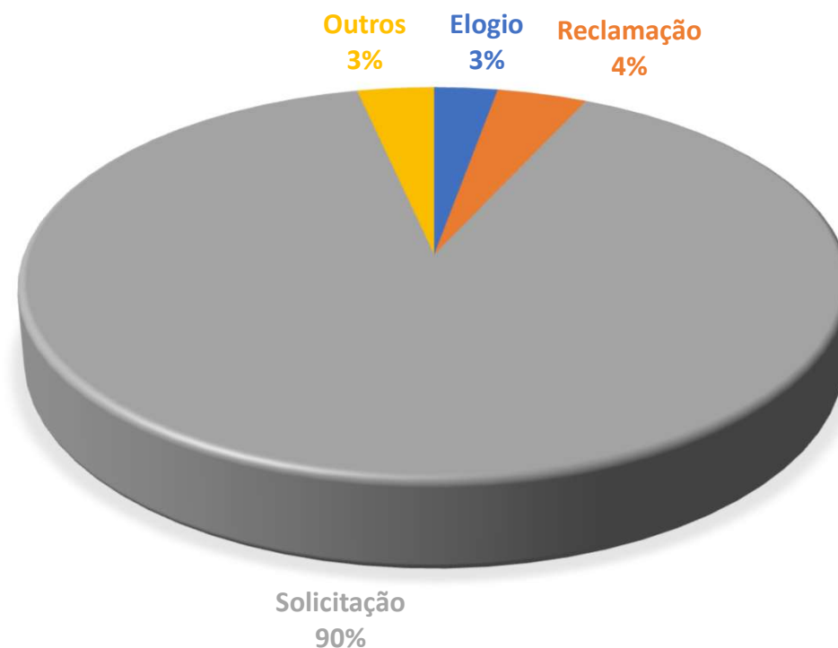
TIPOS DE MANIFESTAÇÃO

* Consideram as solicitações de ressarcimentos e outras solicitações